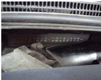
NR VIN NA KAROSERII