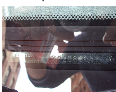
NR VIN NA PODSZYBIU

Wykonane zdjęcia z datą zawarcia polisy AC - przesłać na adres mardox@mardox.pl lub dostarczyć na innym nośniku do Agencji Ubezpieczeń Mardox