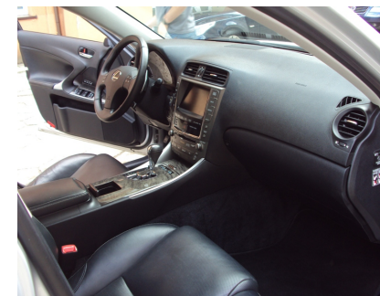
WNĘTRZE OD PASAŻERA