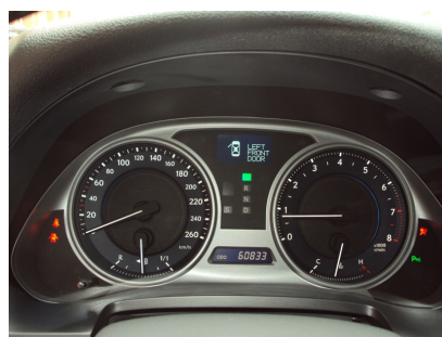
ZEGARY Z PRZEBIEGIEM