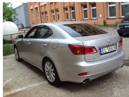
TYŁ + PRAWY BOK