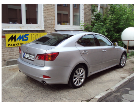
TYŁ + PRAWY BOK