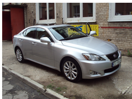
PRZÓD + LEWY BOK