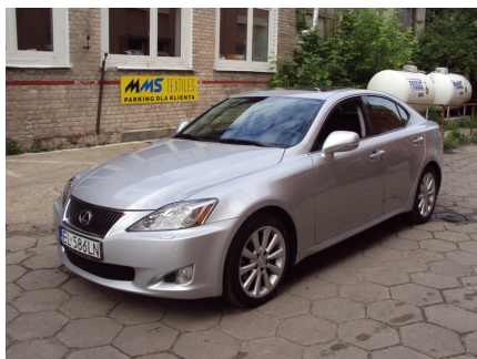
PRZÓD + PRAWY BOK