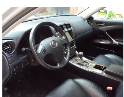
WNĘTRZE OD KIEROWCY